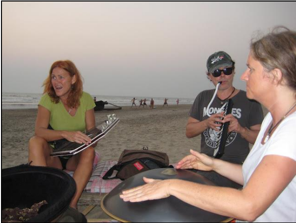
Jam ved solnedgang med tai chi i baggrunden.