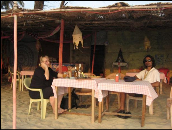
Mange strandrestauranter har stadig et touch af de gode gamle hippiedage.