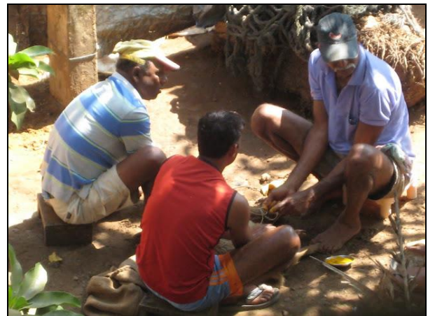
Familiens eneste gris bliver gnedet ind i gult pulver og syet efter operationen.

Senere fik jeg at vide af familiens søn, guesthouse manageren, at det var deres eneste gris, og at den havde haft en gevækst på størrelse med en kartoffel, som den lokale dyrlæge nu havde fået opereret ud.