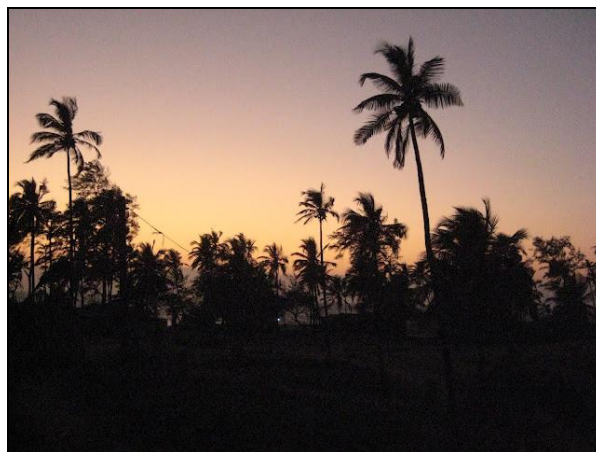
Balkonudsigt i aftenslumringen.

på de 12 kvadratmeters privatsfære – inklusiv balkon – vi hver især har.