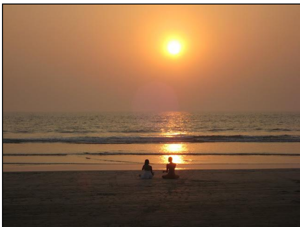
Meditation til solnedgangen.

De mest bemærkelsesværdige oplevelser får man omkring solnedgang. Her myldrer det frem med folk, der dyrker yoga, tai chi, meditation, spiller på håndtrommer eller jonglerer med ild og tunge jernkæder – alt sammen i fuld offentlighed, akkompagneret af den nedadgående sol over havet.