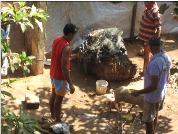
En time efter at den skrigende gris blev indfanget og opereret på den bare jord, rejser den sig igen og går.