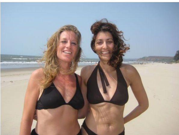
Det skorter ikke på strandbekendtskaber. Forfatteren står tv.