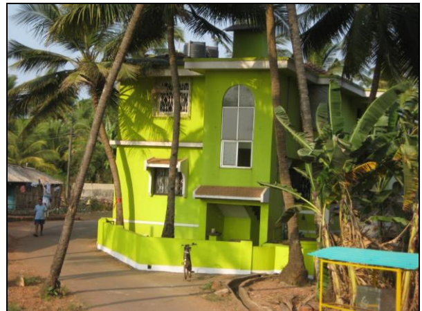
De farvestrålende huse på Goa er en fryd for øjet.