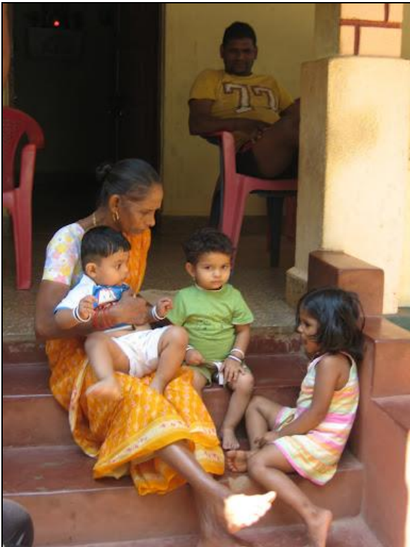
Guesthouse-familiens veranda er både reception og centrum for familieliv. Manageren ses i baggrunden.