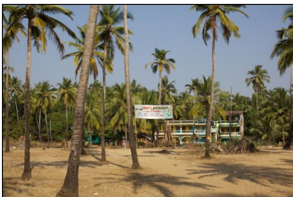
Det familieejede guesthouse ligger som en kulørt enklave i en kokospalme-lund tæt på havet.

"Min mand er min bedste ven. Men vi er som bror og søster og har ikke haft sex i fire år. Og der skal ske noget nyt i mit liv. Det har jeg i den grad indset her. Jeg må videre. Og det kan jeg kun gøre alene."