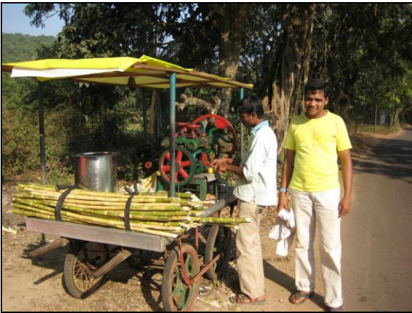
Taxachaufføren (th) inviterer på et glas velsmagende sukkerørsjuice.